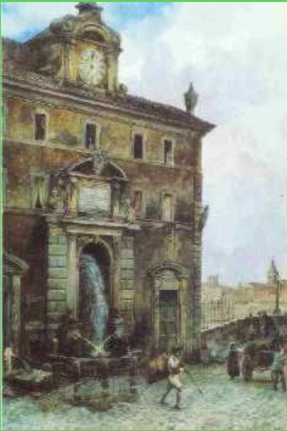
Immagine un po' "vecchiotta" di via Giulia (A. Franz)