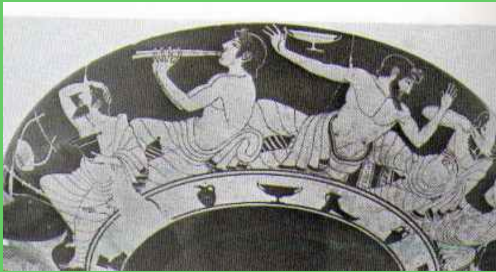
Scena di banchetto, da John Boardman, "Vasi Ateniesi a figure rosse", 1998, p. 174, fig. 305.

E allora è proprio sullo sfondo di questa pericolosa ambiguità che sia Platone che Aristotele calibrarono le proprie riflessioni, imperniandole proprio su quella sulla nozione di “misura” a cui si accennava all’inizio. Una misura che, e questo va ribadito fortemente per tentare quantomeno di ammorbidire i contorni di quello che è diventato un vero e proprio cliché interpretativo, in nessuno dei due filosofi è sinonimo né di inibizione né di condanna tout court [13]. Su questo aspetto, anzi, le posizioni di