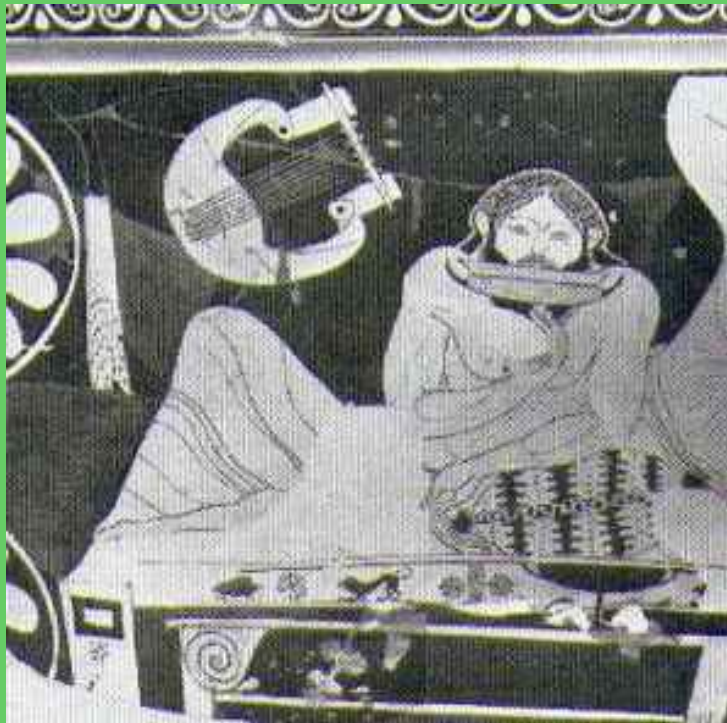
Scena di Simposio ( particolare): bevitore con coppa, da John Boardman, "Vasi Ateniesi a figure rosse", 1998, p. 39, fig. 25.

Di grande interesse, in questo senso, anche le molteplici testimonianze offerte dai testi dei due filosofi, sugli usi, le tradizioni e le abitudini enologiche adottate dalla società greca[31], e ateniese in particolare, allo scopo di arginare il più possibile i rischi legati al bere, fornendo un interessante spaccato di un universo in cui il vino si trovava ad occupare un posto di fondamentale rilievo nell’economia, nella vita domestica e in quella sociale, nell’arte e nella cultura nel suo complesso. Platone, ad esempio, che nelle Leggi affronta espressamente e diffusamente la questione dell’ubriachezza (questione definita «non di poco conto» e considerata a tal punto delicata e complessa da non poter essere affrontata da un «legislatore di scarso valore»[32]), prendendo posizione contro gli Sciti e i Traci, abituati a bere vino «assolutamente puro ( akrato pantapasi )»[33], invita a mescolare il vino in modo da renderlo più leggero e più innocuo. Infatti, osserva sempre il filosofo, appena lo si versa nella coppa, «è forte e ribolle, ma se viene moderato da un altro dio temperante, ottiene una buona