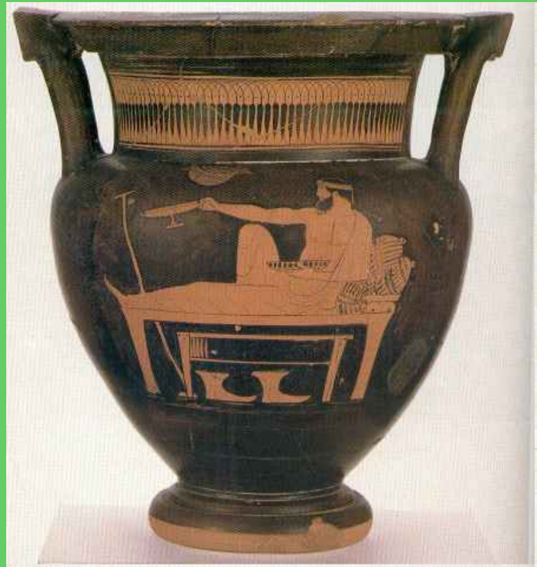
Scena di Simposio: banchettante che gioca al kottabos, da Fede Berti e Carlo Gasparri (a cura di), "Dionysos. Mito e Mistero", 1989, p. 24, fig. 24.

Allora, forse, la ricetta Platonica e Aristotelica potremmo riassumerla con la formula "bere bene ( eu ) per bere meglio", cioè assaporare intelligentemente per diventare sempre più capaci di assaporare; bere in "giusta misura" per godere davvero, per gustare intelligentemente e, dunque, pienamente, il delizioso piacere "di-vino".