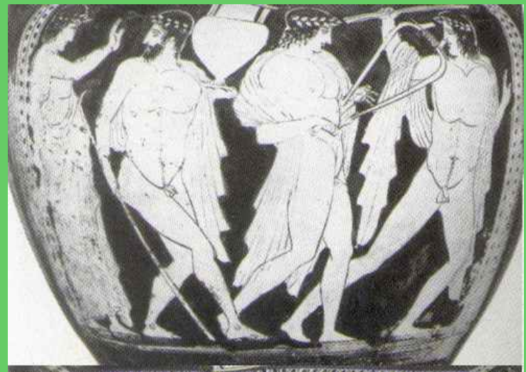
Scena di Kòmos: corteo di bevitori. Da Fede Berti e Carlo Gasparri (a cura di), "Dionysos. Mito e Mistero", 1989, p. 146.

Un dono di dio, certo, e quindi preziosissimo. Se non fosse che il testo del Cratilo richiamato poco fa continua con l'affermazione che «il vino, poi, poiché fa credere a parecchi di quelli che bevono di avere senno, mentre in realtà non ne hanno, potrebbe essere chiamato a buon diritto oionous ("che fa credere di avere senno")»[9]. Ecco manifestarsi nel giro di poche righe la doppia e inquietante faccia di una delle massime divinità del pantheon ellenico (e anzi la divinità "prima per gli uomini", accanto a Demetra, si legge nelle Baccanti [10]), di una divinità benefica e, insieme, potenzialmente malvagia, che nelle seducenti spire del suo dono ha sapientemente occultato un pericolo mortale. Un dono, una medicina prodigiosa per l'anima e per il corpo[11], ma anche un veleno , un