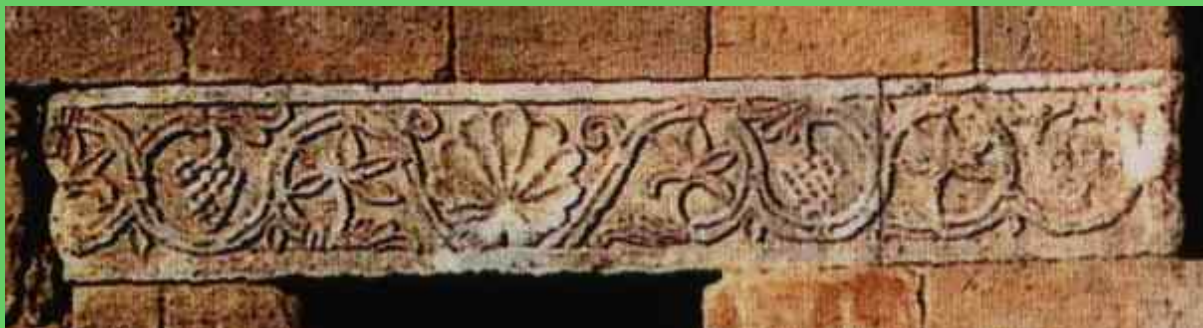
Nella Foto: Santa María de Quintanilla de las Viñas. Decorazione a tralci di vite.

Nell'alto Medioevo, nelle regioni europee con più radicata tradizione vitivinicola, erano molto diffusi i toponimi indicanti località che si trovavano in mezzo ai vigneti, per la maggior parte dedicate alla Madre di Gesù, Maria.