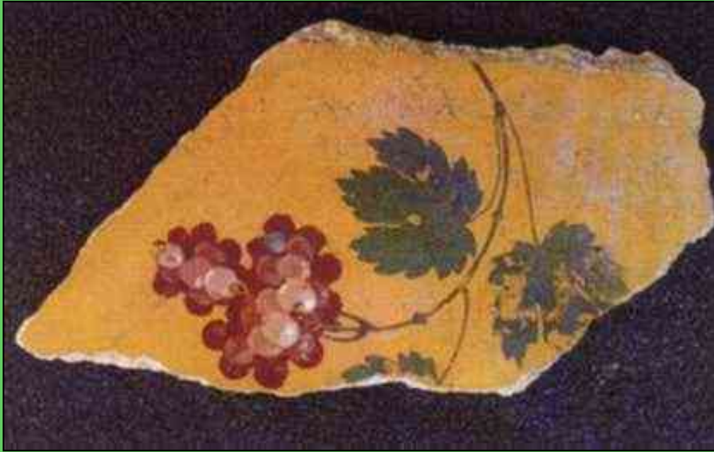
Nella Foto: Frammenti di decorazione pittorica, Affresco proveniente dalla Casa del Bracciale d'Oro, Pompei, tratto da Homo Faber Natura, scienza e tecnica nell'antica Pompei, a Cura di A. Ciarallo, E. De Carolis. ELECTA 1999)

sicuramente un vino rosso, importante, ben strutturato. All'80 per cento sarà formato dal vitigno Piediroso, il resto dal vitigno Sciascinoso".